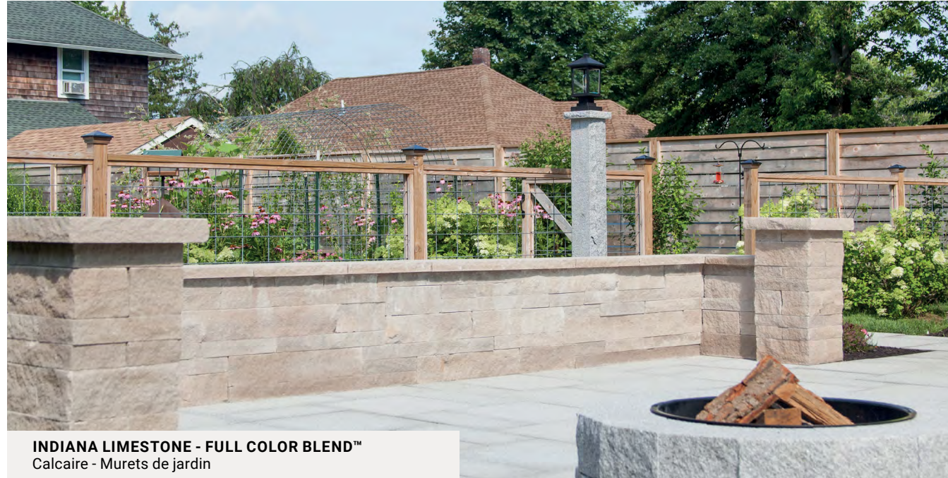
INDIANA LIMESTONE - FULL COLOR BLEND™ Calcaire - Murets de jardin

Les murets de jardin apportent une touche décorative unique à tout aménagement. Bien qu'ils ne soient pas conçus pour servir de soutènement, ces produits peuvent être empilés à sec et sont parfaits pour délimiter les platebandes et pour l'aménagement paysager.